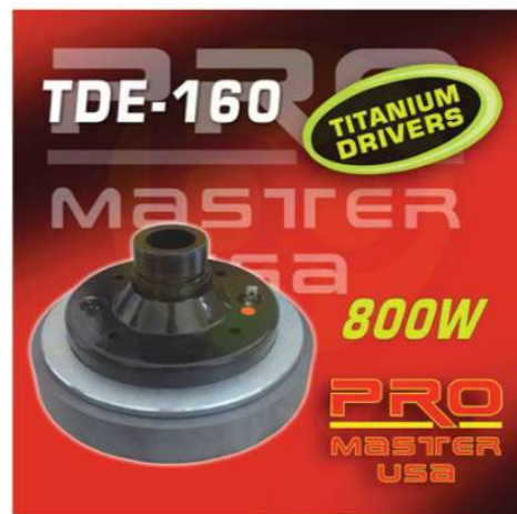
TDE 160 -Driver 8 Ohmios -800 W Q270.00