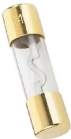
F4257 Fusible para amplificador