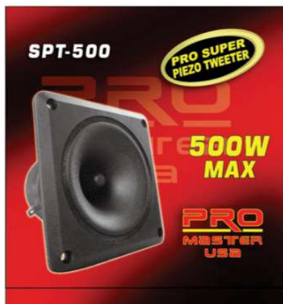
SPT 500 TWEETER 4.3" 500 W Q16.00