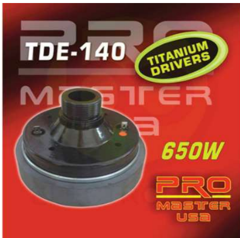
TDE 140 -Driver 8 Ohmios -650 W Q225.00