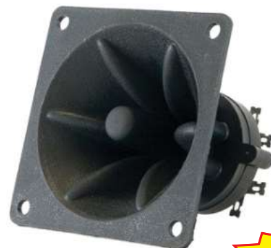
PET 100 Tweeter tipo Piezo 100 W Q10.00