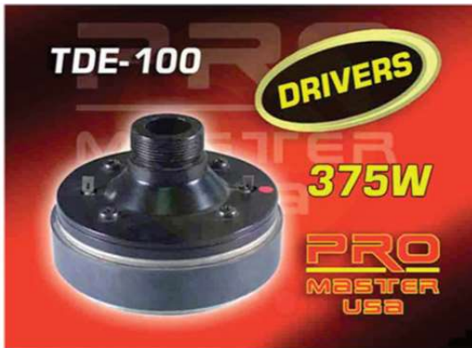
TDE 100 -Driver 8 Ohmios -375 W Q190.00