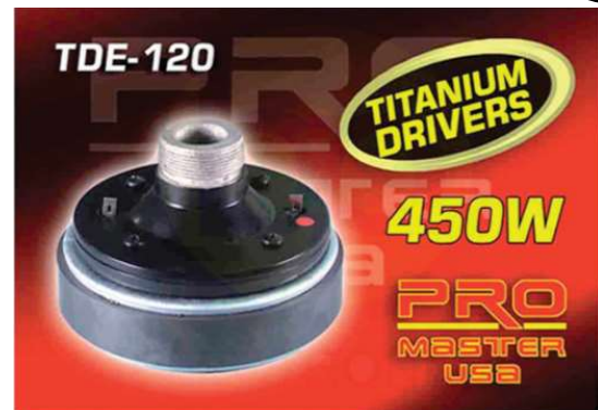
TDE 120 -Driver 8 Ohmios -450W Q210.00