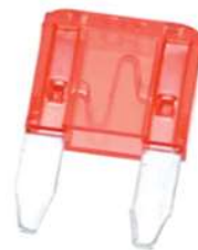
Fusible de Carro Tamaño: 5X11 mm