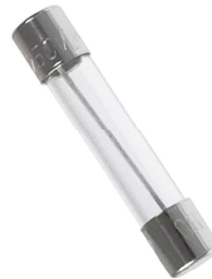
FGMA Fusible europeo 5x20 mm