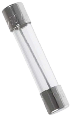
FAG Fusible americano 6x30 mm