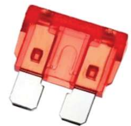
Fusible de Carro Tamaño: 9X19 mm