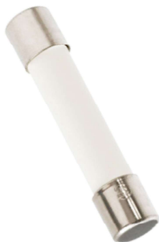
FM Fusible americano cerámico 6x30 mm