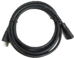
EXT 33582 (Ext hdmi-hdmi 6ft)