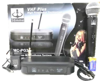
MIC MCPG24 (Micrófono con estuche)