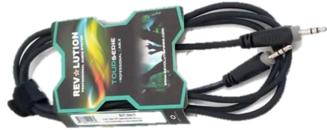
EXT 20410 (Ext 3.5 plug a 3.5 plug Revolution)