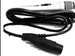
MIC 10800 (Micrófono)