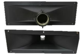
PET 515 Base para Driver de 5x15"