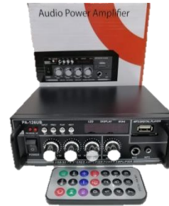
PA 126 UB (Amplificador 12V 120W)