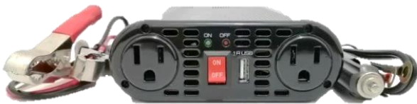
INV AH630R (Inversor RCA 300 wts continuos USB)