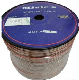
ROLLO 14C (Cable Mivics claro 300mts)