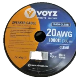
ROLLO HA 20C (Cable VOYZ claro 300mts)